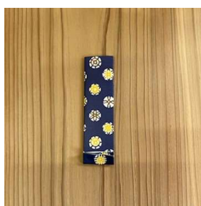
⑦ 裏返して下を少し折上げる