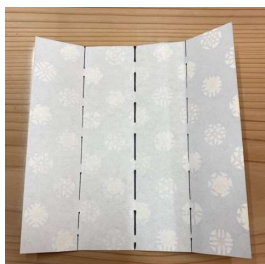
② 四つ折りにして広げる