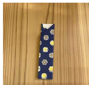
⑥ そのまま二つ折り