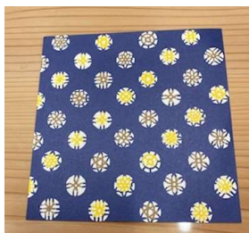
① 好きな色紙を選ぶ