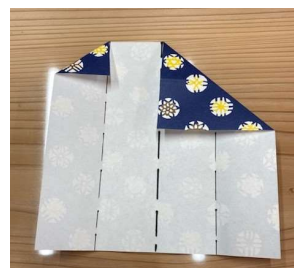
③ 右端を中央に左端は一つ目の折り目